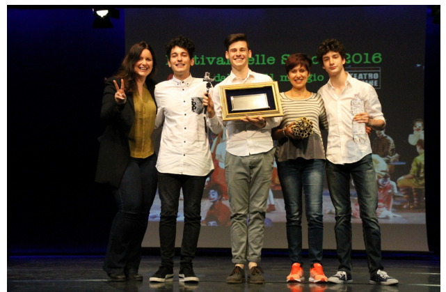
I vincitori dell'edizione 2016: Liceo Scientifico Antonelli di Novara