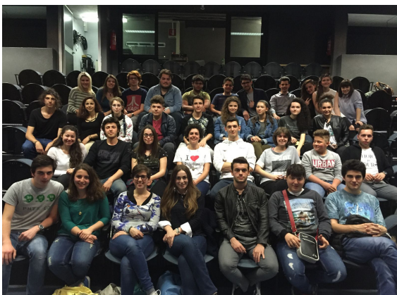
Festival 2016: la Giuria di Ragazzi

Il Festival delle Scuole è un Concorso di Teatro a cui sono ammessi, previa compilazione della domanda allegata, gruppi di teatro delle Scuole Secondarie di 2° grado . Il Concorso si svolge durante il mese di maggio e la Cerimonia di Premiazione dei vincitori si tiene domenica 28 maggio 2017 all'ITC Teatro di San Lazzaro. L'iscrizione è gratuita . Per partecipare è sufficiente, dopo aver letto il bando di concorso, compilare e firmare il modulo di iscrizione e la scheda di partecipazione allegati e inviarli con le modalità e nei tempi indicati. I gruppi partecipanti si esibiscono davanti a una giuria composta interamente da ragazzi e ragazze , provenienti da tutte le scuole in concorso, che dovranno valutare testo e recitazione, grado di difficoltà e originalità, costumi, scene e musiche degli spettacoli in gara. La giuria è senz'altro una delle cose più belle nonché il simbolo di questa rassegna dedicata ai più giovani. Al termine della manifestazione, la scuola prima classificata riceverà un premio in denaro pari a euro 1.500 , che la scuola si impegna a spendere nell'organizzazione di attività culturali destinate agli allievi, nonché il diritto a partecipare all'edizione 2018 della Manifestazione Teatro Lab organizzata dal Centro Teatrale Europeo Etoile sul territorio della Provincia di Reggio Emilia.