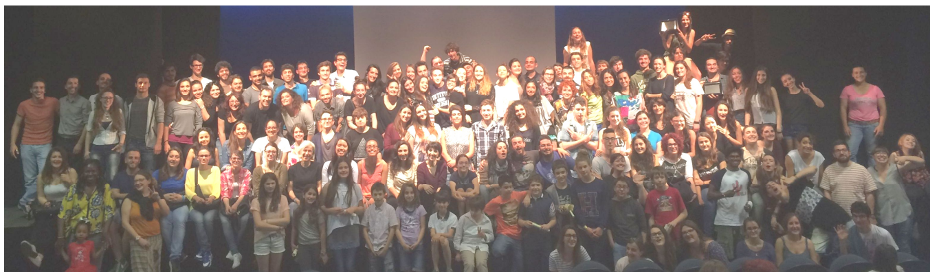
La celebrazione dei vent'anni del Festival con i partecipanti delle passate edizioni, dal 1995 al 2015

2017 - grazie all'esperienza pluri-ventennale nelle scuole, nasce Futuri Maestri , progetto dedicato a bambine, bambini e adolescenti dai 3 ai 18 anni (vedi ultimo allegato).