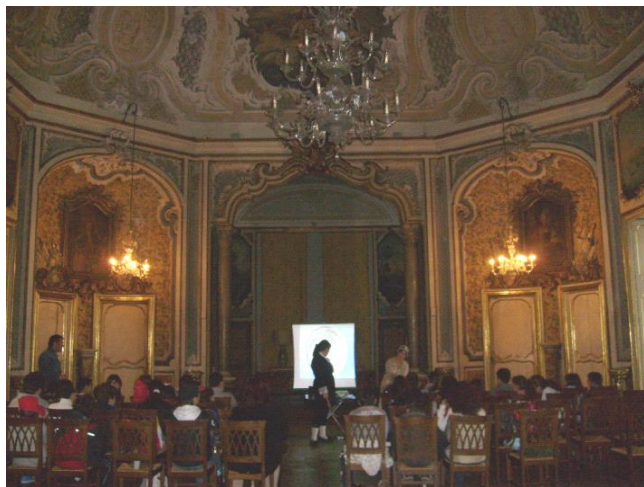
Palazzo Biscari, Catania, la rinascita barocca della città dopo il terremoto del 1693, palazzo dalle 600 stanze