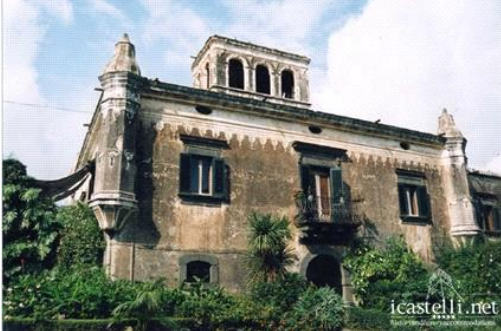
Castello degli Schiavi (sec. XVIII), Fiumefreddo (CT)