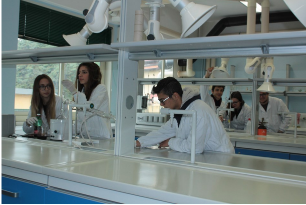
Il laboratorio didattico di chimica

Il Dirigente Scolastico ed i docenti saranno a disposizione per fornire informazioni sulle proposte didattiche e la strutturazione dei percorsi formativi del nostro Istituto, nonché i possibili sbocchi professionali e di studio, conoscere i trend occupazionali e le opportunità di lavoro relative ai settori di interesse.