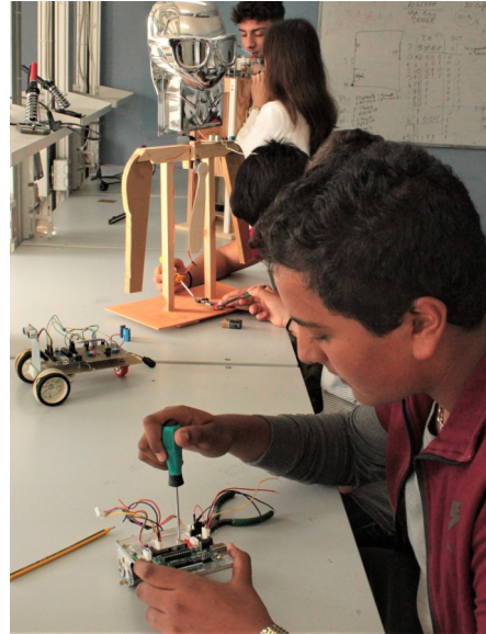
Il laboratorio didattico di robotica