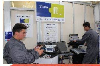
MANUTENZIONE ED ASSISTENZA DEI MEZZI DI TRASPORTO