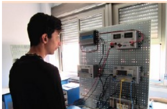
DOMOTICA E MACCHINE ELETTRICHE