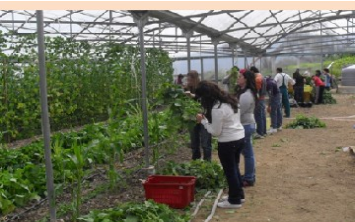
AZIENDA AGRARIA CON SERRA