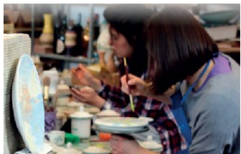
ARTIGIANATO DELLA CERAMICA