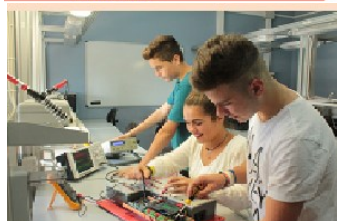
ELETTROTECNICA ED ELETTRONICA